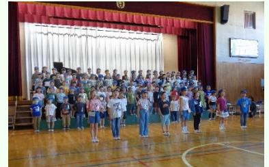
1年生みんなで感謝の合唱