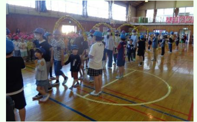
6年生と一緒に手をつないで入場