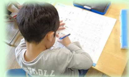
楽しく授業に取り組む1年生

います。今月も藤久保小学校の教育活動へのご理解ご協力をどうぞよろしくお願いいたします。