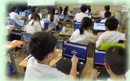
社会科で真剣に話し合う4年生