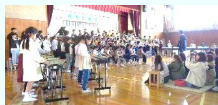
心を1つに、命を輝かせる子どもたち

※子どもの権利条約・・・1989年の第44回国連総会にて採択、1994年に日本が批准しました。