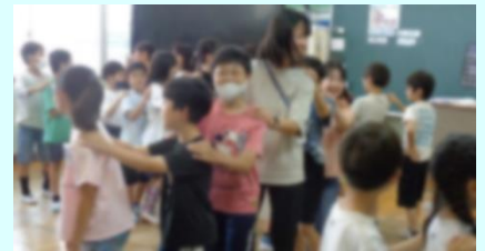
縦割り活動でみんな仲よく

運動会では、自分の目標に向かって進んで挑戦し、達成感や成就感を味わっていました。授業のめあてに向かって粘り強く取り組む子がたくさんいました。体育の授業では、なりたい自分をめざして、一生懸命に運動するたくましい子どもの姿が見られました。